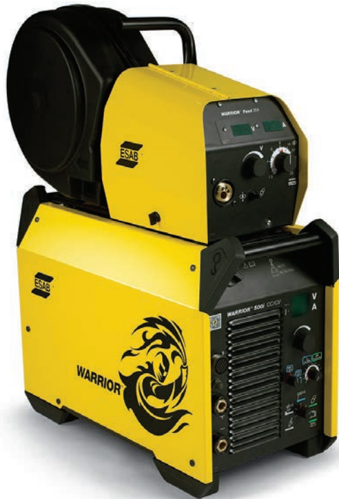
Warrior 500i con alimentador de alambre Warrior Feed 304.

La Warrior 500i es una máquina para soldar confiable y multiproceso diseñada para una productividad de alto desempeño produciendo hasta 500 amperios y con excelentes características de arco.