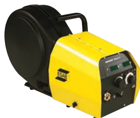
Warrior Feed 304