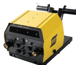
Warrior Feed Dual 304