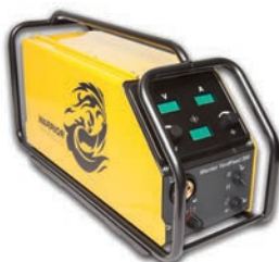
Warrior YardFeed 200