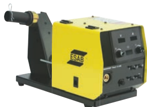
Warrior Feed 404HD